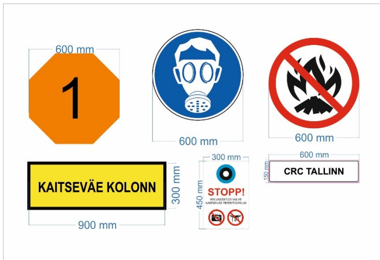
Pildid 3-5. Näidised: